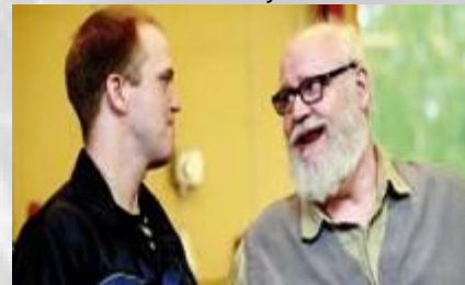
Ampuja (2010) Villilä Studiot Oy