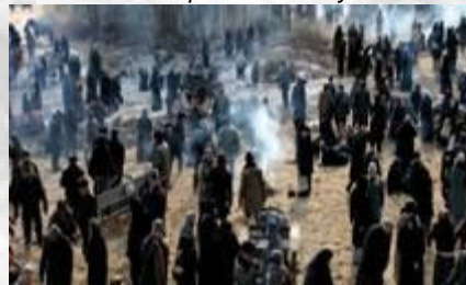
Täällä Pohjantähden alla (2009) Artista Filmi Oy