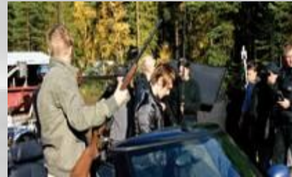
Game Over (2005) Kinofinlandia Oy