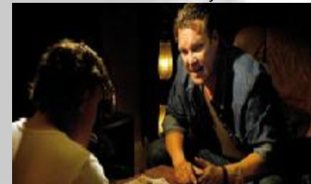
V2 – Jäätynyt enkeli (2007) Solar Films Oy