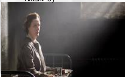
Hella W (2011) Snapper Films Oy