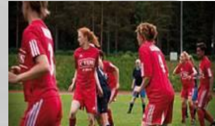
FC Venus (2005) Talent House Oy