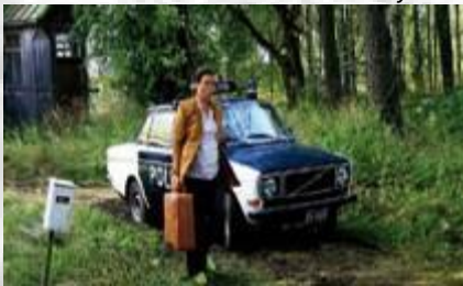
Postia pappi Jaakobille (2009) Kinotar Oy