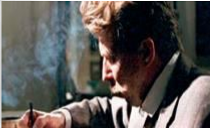
Sibelius (2003) Artista Filmi Oy