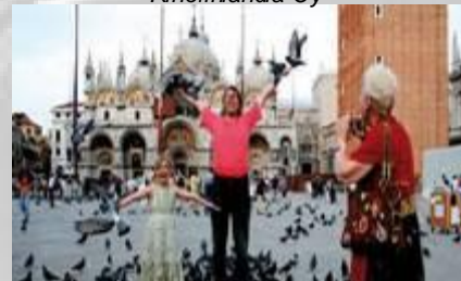
Kalteva torni (2006) Artista Filmi Oy