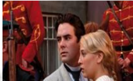
Kaksipäisen kotkan varjossa (2005) Artista Filmi Oy