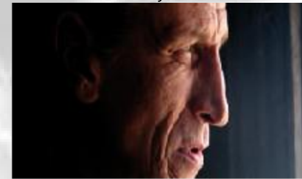
Täällä Pohjantähden alla 2 (2010) Artista Filmi Oy