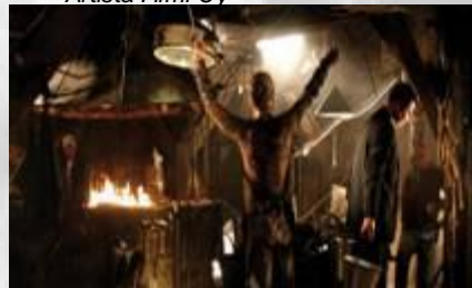
Jadesoturi (2006) Blind Spot Pictures Oy